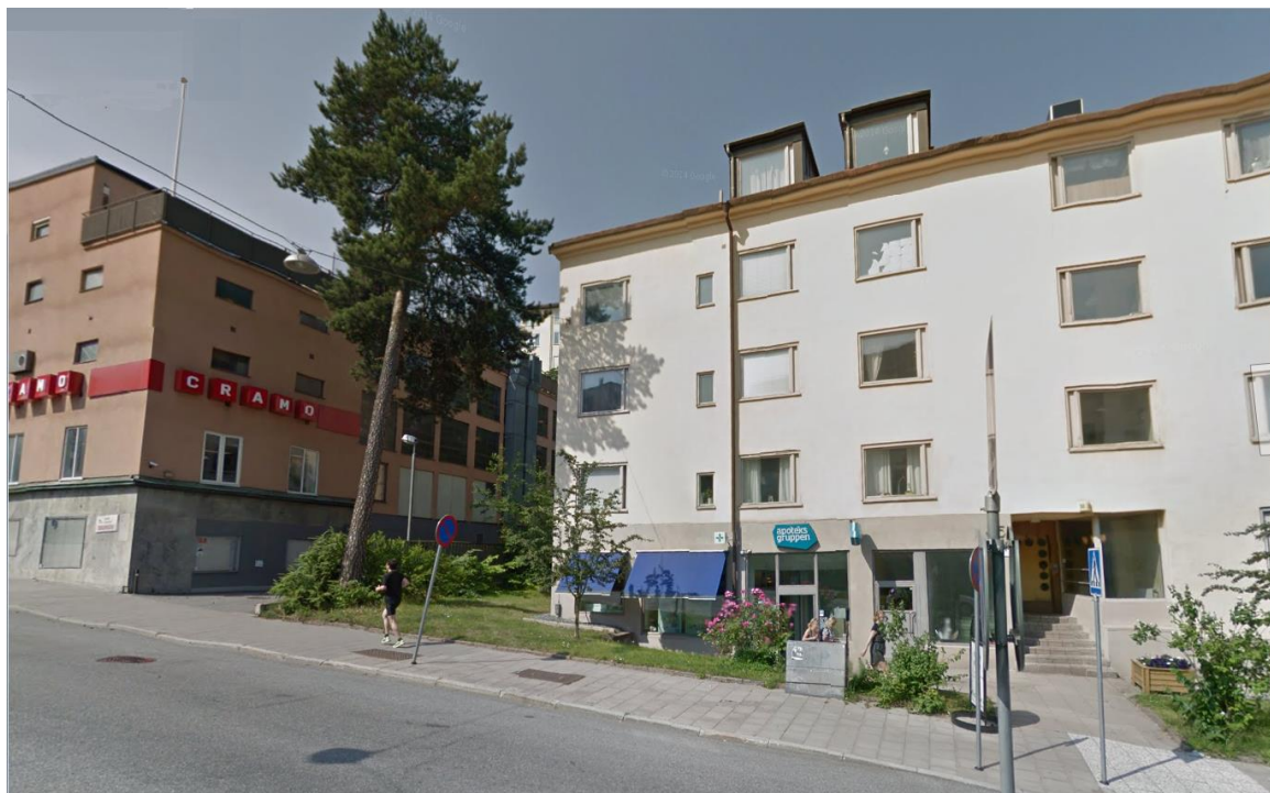
Solig morgon: Ordonnansen 6 t v (3/4 våningar) och Ordonnansen 8 t h (3 våningar + inredd vind)

I söder får västra huset byggas +50 m där inget fick byggas och ut över Furusundsgatans backe! Längs Värtavägen +65,5 m där inget fick byggas, dvs upp till 35 m högre än mark! Då försvinner grönyta och träd. Långt höghus byggs utan förgård tvärs emot Gärdesstadens skyddsbestämmelser!